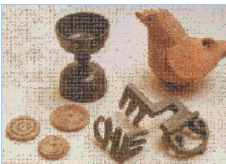
Vestigios Galoromanos Excavaciones de Diodurum