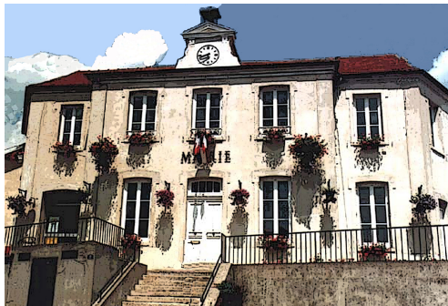
Ayuntamiento de Jouars-Pontchartrain Construido en 1866