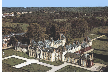
Castillo de Pontchartrain 1660 Parque diseñado por el paisajista del Rey, Le Nôtre